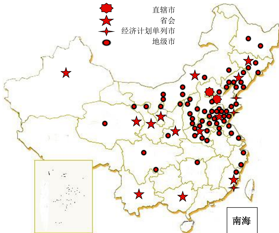
“JODOLL 乔顿”品牌网络覆盖图

乔顿服饰的市场开拓，通过实施名牌战略，除了优化产品结构，提高产品竞争力外，将主要精力放在终端建设和渠道转型上，以品牌连锁网络建设试点工作为契机，大力开拓国内市场：加强拓展中西部地区二线城市市场，争取一年重点建立或完善一到两个省的主要销售网络；改变原来单一的加盟模式，积极发展直营店，让公司的品牌发展策略能顺利执行，且将每个直营店做成精品店、销售强店。