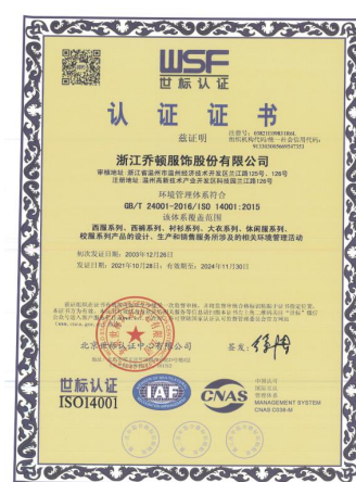
职业健康安全管理体系证书