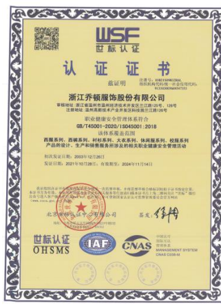
环境管理体系认证证书