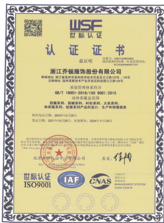
质量管理体系认证证书

公司顺利通过了 ISO19001-2015 质量管理体系认证，ISO14001 环境管理体系和 OHSAS18001 职业健康安全管理体系。并取得了中国环境标志产品认证、全国商标售后服务达标认证（五星级）、CTEAS 售后服务体系完善程度认证（七星级）、中国绿色产品认证等。